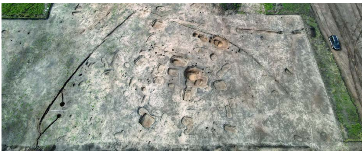
Один из усадебных комплексов. На фото видны котлованы погребов, канавки от ограды и въезд на усадьбу с двумя ямами от столбов ворот по сторонам

это следы погребов, которые находились непосредственно под жилищами. На территории одной из усадеб были найдены детали хороса (светильника в православном храме) – это позволяет предположить, что где-то на территории усадьбы проводились богослужения.