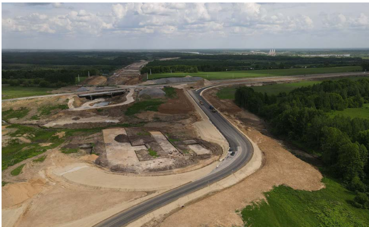
Раскопки на селище Чадаево 5