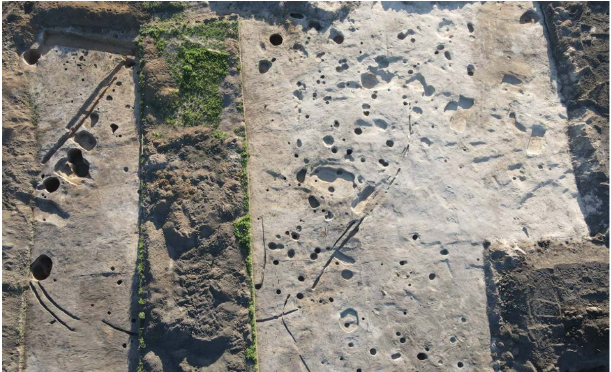
Селище Чадаево 5

Селище Чадаево 5 было обнаружено в 2020 году в ходе историко-культурной экспертизы перед строительством автотрассы М12 Москва – Нижний Новгород – Казань. Летом 2021 года начались раскопки, которые продолжаются в археологическом сезоне 2022 года. Практически вся территория средневекового поселения оказалась в зоне строительства, что потребовало организации широких спасательных раскопок. За два полевых сезона исследовано более 30 тысячи кв. метров. Планируется, что к моменту окончания раскопок будет вскрыта вся площадь памятника, которая оценивается примерно в 3,5 га. После окончания работ ранее никому не известное селище Чадаево 5 станет одним из наиболее полно исследованных раскопками сельских поселений домонгольского ремени в Волго-Окском междуречье.