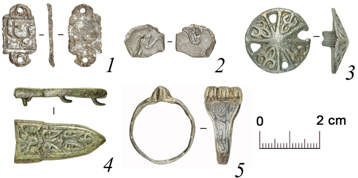
Сверху: 1,4 – детали книжных переплетов, 2,3 - ременные пряжки. Внизу слева направо: 1 – накладка, 2 – свинцовая пломба, 3 – пуговица, 4 – наременная накладка, 5 – перстень

«Исключительно важны археологические следы присутствия на сельском поселении древнерусской знати: оружие, стили для письма, товарные пломбы с княжескими знаками. Участники раскопок точно назвали остатки одной из построек с внушительным по размерам котлованом подполья "хоромами" – это, действительно, жилище семьи, выделявшейся своим благосостоянием и статусом. После завершения раскопок Чадаево 5 станет наиболее полно исследованным древнерусским селищем XII века в центральной России. Но, чтобы окончательно разобраться в этом материале, потребуется изучение коллекций, анализ полевых чертежей, лабораторное исследование разнообразных палеоэкологических материалов, характеризующих палеосреду и хозяйство», – сказал Николай Макаров .