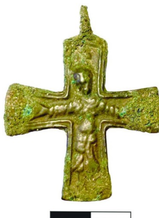
Крест с грубым изображением Распятия